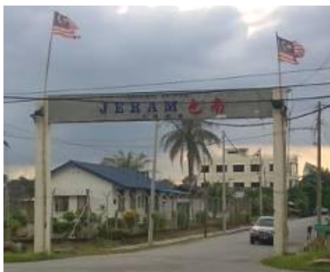
图 2: 大牌楼