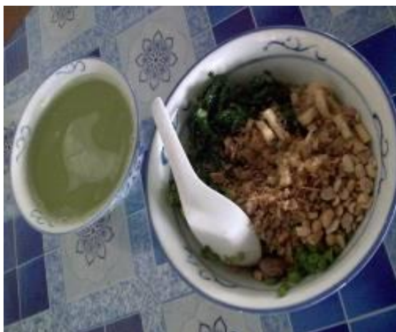
图 15: 也南闻名的河婆擂茶

除此之外，也南以前有一间藤加工厂，主要是处理藤，然后再送到金宝或怡保售卖。但是，由于藤的来源逐渐减少，这间加工厂也停业了。也南也种植了许多水果，如黄梨、甘蔗、酸柑和香蕉等，也有种植了一些农作物，如玉蜀黍和蔬菜等。一些居民则在也南从事割胶和油棕的行业。