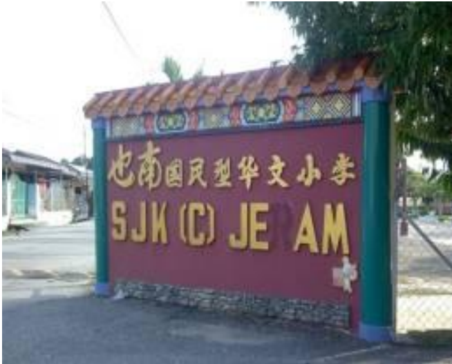
图 18: 也南国民型华文小学