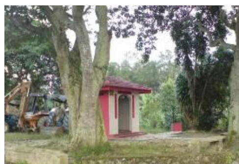
图 4: 拿督公神庵