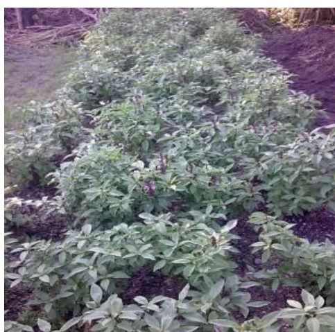
图 13: 插茶绝对不可少的九层塔