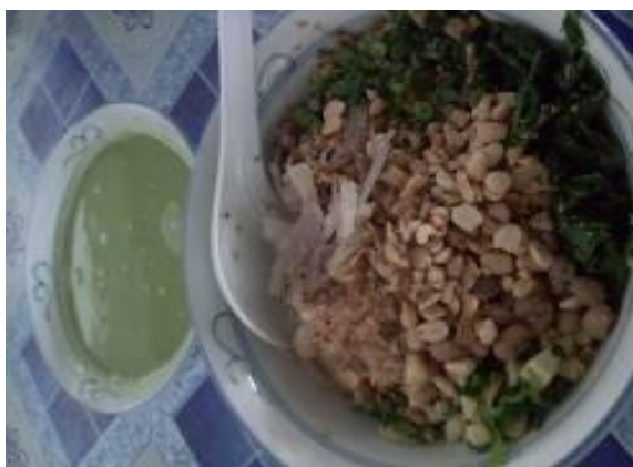
图 16: 素的河婆擂茶

除此之外，也南以前有一间藤加工厂，主要是处理藤，然后再送到金宝或怡保售卖。但是，由于藤的来源逐渐减少，这间加工厂也停业了。也南也种植了许多水果，如黄梨、甘蔗、酸柑和香蕉等，也有种植了一些农作物，如玉蜀黍和蔬菜等。一些居民则在也南从事割胶和油棕的行业。