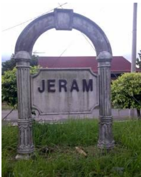
图 1: 小牌楼

防队。这些公会或团体成立的宗旨是帮助也南村民争取更多的福利、解决民生问题及发展新村。