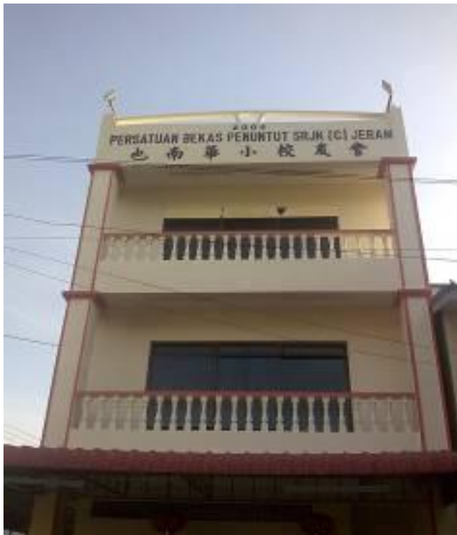
图 19: 也南华小校友会