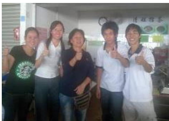
图 17: 闻名也南的清姐擂茶