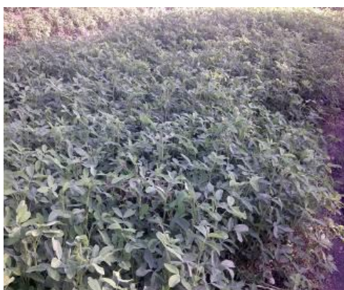
图 14: 花生苗