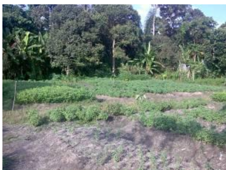
图 12: 花生和九层塔园

时间。她也打趣地形容九层塔犹如小姐一般，需要烹调者的细心照顾和加以呵护，方能煮出口感极佳、味道芳香的“河婆插茶”。